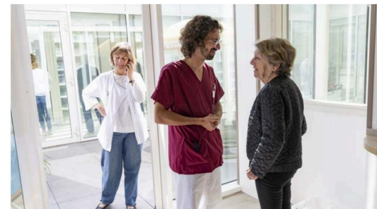
Les espaces sont pensés pour préserver la sécurité et l'intimité des patients. La pièce de vie principale est la cuisine, prolongée par un patio végétalisé.