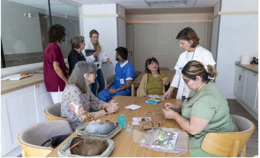
Les personnes accueillies sont autonomes mais leurs troubles ne permettent pas une prise en charge dans une unité classique et nécessitent un accompagnement sécurisé.