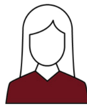
Équipe de Rééducation et Brancardiers