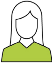
Agent Hôtelier Spécialisé